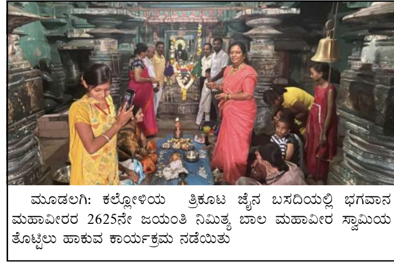
ಮೂಡಲಗಿ: ಕಲ್ಲೋಳಿಯ ತ್ರಿಕೂಟ ಜೈನ ಬಸದಿಯಲ್ಲಿ ಭಗವಾನ ಮಹಾವೀರರ 2625ನೇ ಜಯಂತಿ ನಿಮಿತ್ತ ಬಾಲ ಮಹಾವೀರ ಸ್ವಾಮಿಯ ತೊಟ್ಟಿಲು ಹಾಕುವ ಕಾರ್ಯಕ್ರಮ ನಡೆಯಿತು