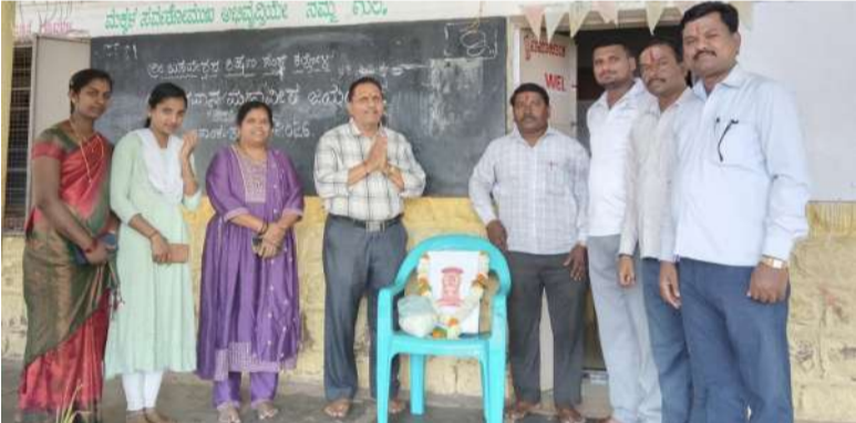
ಬೆಳಗಾವಿ ವಾರ್ತೆ ಮೂಡಲಗಿ: ಭಗವಾನ್ ಮಹಾವೀರರ ಸಂದೇಶಗಳು.