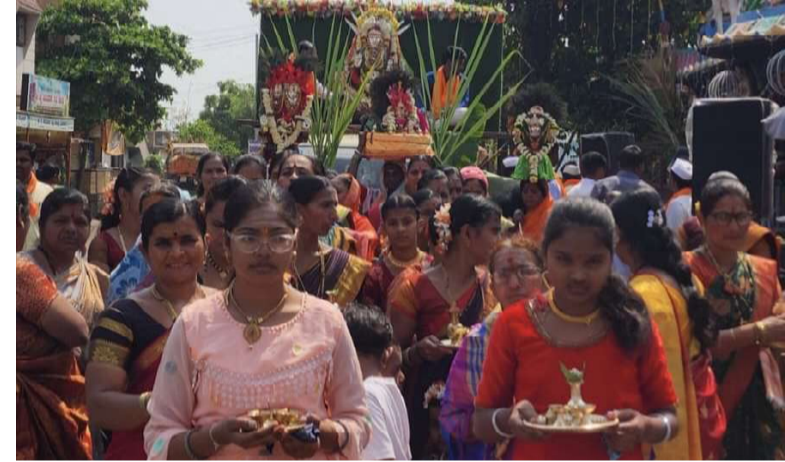
ಮೆರವಣಿಗೆ ಜರುಗಿತು. ಮಧ್ಯಾಹನ ದೇವಿಗೆ ದಂಡಿ ದಾರಣೆ ಮಾಡುವುದು ಮತ್ತು ಹಡ್ಡಲಗಿ ತುಂಬುವುದು ಮತ್ತು ಅನ್ನ ಪ್ರಸಾದ ಜರುಗಿತು.

ಬೆಳಗಾವಿ ವಾರ್ತೆ ಮೂಡಲಗಿ : ಪಟ್ಟಣದಲ್ಲಿ ಶ್ರೀ ಶಿವಬೋಧಧರಂ ಮಠದ ರಸ್ತೆಯಲ್ಲಿನ ಶ್ರೀ ರೇಣುಕಾ ಯಲ್ಲಮ್ಮಾದೇವಿ ದೇವ ಸ್ಥಾನ ದಲ್ಲಿ ಶ್ರೀ ರೇಣುಕಾ ಯಲ್ಲಮ್ಮಾದೇವಿ ಜಾತ್ರೆ ಮಹೋತ್ಸವ ಬುಧವಾರ ಜರುಗಿತು. ಜಾತ್ರೆಯ ನಿಮ್ಮಿತ್ಯ ಮುಂಜಾನೆ 6.00 ಗಂಟೆಗೆ ಶ್ರೀ ದೇವಿಗ ವಿಶೇಷ ಅಭಿಷೇಕ ಮತ್ತು 8.00 ಗಂಟೆಯಿಂದ 10.00ರ ವರೆಗೆ ದೇವಿಗೆ ಉಡಿ ತುಂಬುವ ಕಾರ್ಯಕ್ರಮ ಜರುಗಿತು. ಪಟ್ಟಣದ ಸಂಗಪ್ಪಣ್ಣ ವೃತ್ತ, ಕಲ್ಲೇಶ್ವರ ವೃತ್ತ, ಚನ್ನಮ್ಮ ವೃತ್ತ, ಕರಮ್ಮದೇವಿ ವೃತ್ತ ಮತ್ತು ಬಸವೇಶ್ವರ ವೃತ್ತ ಮೂಲಕ ಕುಂಭ ಮೇಳ ಮತ್ತು ವಾದ್ಯಮೇಳದೊಂದಿಗೆ ದೇವಿಯ ಉತ್ಸವ