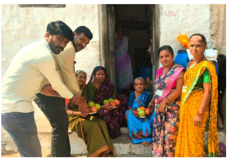
ಮೇಲ್ವಿಚಾರಕರು, ಸೇವಾ ಪ್ರತಿನಿಧಿಗಳು ಹಾಗೂ ಸಿಬ್ಬಂದಿ ವರ್ಗದವರು ಉಪಸ್ಥಿತರಿದ್ದರು.