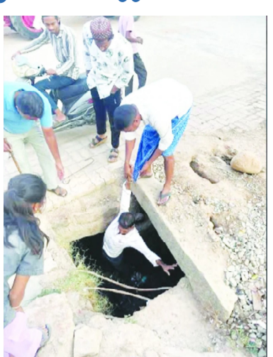
ಹೊಣೆಗಾರರು ಯಾರು? ಎಂಬುದು ಸಾರ್ವಜನಿಕರ ಅಳಲಾಗಿದೆ.

ಬೆಳಗಾವಿ ವಾರ್ತೆ ಲಕ್ಷ್ಮೇಶ್ವರ: ಪಟ್ಟಣದ ಅನೇಕ ಕಡೆ ಬಾಯ್ತೆರೆದ ಚರಂಡಿಗಳು, ಹಳ್ಳ ಹಿಡಿದ ಒಳಚರಂಡಿ ಯೋಜನೆಯ ಚಂಬರ್‌ಗಳು, ಕುಸಿದ ಸಿಡಿಗಳು ಅಪಾಯಕ್ಕೆ ಆಹ್ವಾನ ನೀಡುತ್ತಿವೆ. ನಿತ್ಯ ಇವುಗಳಿಂದ ಬಚಾ ವಾಗಲು ವಾಹನ ಸವಾರರು, ಮಕ್ಕಳು, ವೃದ್ಧರು ಜೀವ ಭಯದಲ್ಲಿ ಸಂಚರಿಸುವಂತಾಗಿದೆ. ಇವುಗಳಿಂದ ದಿನನಿತ್ಯ ಅನಾಹುತ, ಅಪಘಾತ, ಅನಾಹುತ ಅಗುತ್ತಲೇ ಇರುತ್ತವೆ. ಮನೆಯಿಂದ ಹೊರ ಹೋದವ ರನ್ನೂ ದೇವರೇ ಕಾಪಾಡಬೇಕು ಎಂಬ ಪರಿಸ್ಥಿತಿ ಇಲ್ಲಿಯಾಗಿದೆ. ಸಾರ್ವ ಜನಿಕರು ಪುರಸಭೆಯ ಕಾರ್ಯವೈಖರಿಗೆ ಹಿಡಿತಾಪ ಹಾಕುತ್ತಲೇ ಇರುತ್ತಾರೆ.