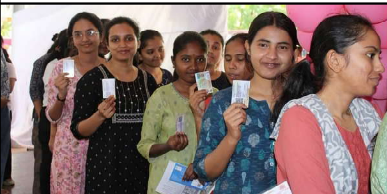
ಅಂಬೇಡ್ಕರ ಭವನದಲ್ಲಿ ಸ್ಥಾಪಿಸಲಾದ ಪಿಂಕ್ ಮತಗಟ್ಟೆಯಲ್ಲಿ ಯುವ ಮತದಾರರು ಮತ ಚಲಾವಣೆಗೆ ಉತ್ಸಾಹದಿಂದ ಸಾಲುಗಟ್ಟಿ ನಿಂತಿರುವ ದೃಶ್ಯ.