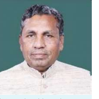
ಪ್ರತಿಕ್ರಿಯಿಸಿದ ಅವರು, ಅರ್ಹ ಬಿಬಿಎಲ್ ಕಾರ್ಡ್‌ದಾರರ ಕಾರ್ಡ್‌ಗಳನ್ನು ತೆಗೆದು ಹಾಕಿಲ್ಲ. ಅನರ್ಹ ಕಾರ್ಡ್‌ಗಳನ್ನು ರದ್ದು ಮಾಡಿದ್ದೇವೆ ಅಷ್ಟೇ ಎಂದು ಹೇಳಿದರು.

ಎಲ್‌ಪಿಜಿಯನ್ನು ಕಾಳಸಂಕೆಯಲ್ಲಿ ಮಾರಾಟ ಮಾಡುವುದಕ್ಕೆ ಕಡಿವಾಣ ಹಾಕುತ್ತಿದ್ದೇವೆ. ತೂಕ ಮತ್ತು ಅಳತೆ ಇಲಾಖೆಯ ಸಭೆಯನ್ನು ಕರೆದಿದ್ದೇನೆ. ಅವರಿಗೂ ಕಾಳಸಂಕೆ ಮಾರಾಟಕ್ಕೆ ಬ್ರೇಕ್ ಹಾಕುವಂತೆ ಸೂಚನೆ ಕೊಟ್ಟಿದ್ದೇನೆ. ಜತೆಗೆ ಎಲ್ಲಾ ತೈಲ ಕಂಪೆನಿಗಳ ಮುಖ್ಯಸ್ಥರ ಸಭೆಯನ್ನು ನಾಳೆ ಕರೆದು ಚರ್ಚಿಸುತ್ತೇನೆ ಎಂದು ಅವರು ತಿಳಿಸಿದರು.