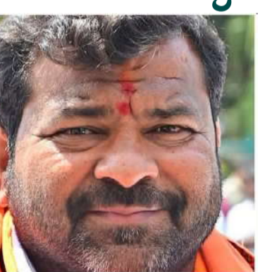
ಜೊತೆಗೆ ಕೋವಿಡ್ -19 ಅವಧಿಯಲ್ಲಿ ಉಚಿತ ಲಸಿಕೆ ಮತ್ತು ಚಿಕಿತ್ಸೆಗಳನ್ನು ನೀಡಿದ.