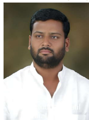
ಬೆಳಗಾವಿ ವಾರ್ತೆ ವೋಳಿ: ಪಂಚಮಸಾಲಿ ಸಮಾಜದ

ಅವರು ಇಂದು ಕಾಗವಾಡ ಪಟ್ಟಣ ದಲ್ಲಿ ಸುದ್ದಿಗಾರರೊಂದಿಗೆ ಮಾತನಾಡುತ್ತ ಈ ವಿಷಯ ತಿಳಿಸಿದರು. ಪಂಚಮಸಾಲಿ ಸಮಾಜಕ್ಕೆ 2 ಎ ಮೀಸಲಾತಿ ನೀಡಬೇಕು