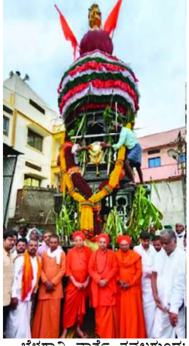
ಬೆಳಗಾವಿ ವಾರ್ತೆ ನವಲಗುಂದ: ಪಟ್ಟಣದಲ್ಲಿರುವ ಗವಿಮಠದ ಸಿದ್ಧಲಿಂಗೇಶ್ವರ ರಥೋತ್ಸವವು ಸಾವಿರಾರು ಭಕ್ತರ ಸಮ್ಮುಖದಲ್ಲಿ ವಿಜೃಂಭಣೆಯಿಂದ ನಡೆಯಿತು. ರಥೋತ್ಸವದ ಅಂಗವಾಗಿ