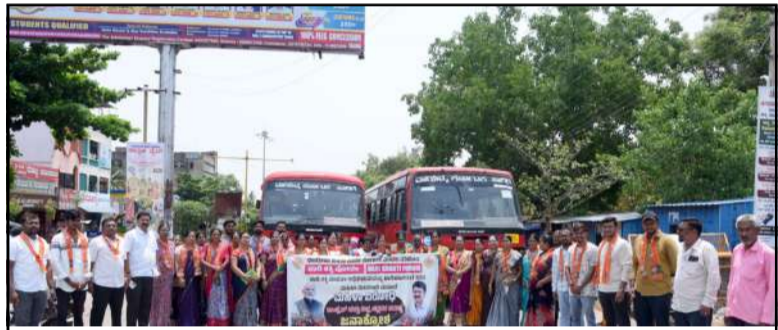
ಬೆಳಗಾವಿ ವಾರ್ತೆ ಗೋಕಾಕ: ಭಾರತೀಯ ಜನತಾ ಪಾರ್ಟಿ ಗೋಕಾಕ ಮಂಡಳಿ ವತಿಯಿಂದ ನಾರಿ ಶಕ್ತಿ ವಂದನಾ ಅಧಿನಿಯಮವನ್ನು ಜಾರಿಯಾಗದಂತೆ ತಡೆದು ಮಹಿಳಾ ವಿರೋಧಿ ಕಾಂಗ್ರೆಸ್ ಮತ್ತು ಮಿತ್ರಪಕ್ಷಗಳ ವಿರುದ್ಧ ಮಹಿಳಾ ಮೋರ್ಚಾ ಪದಾಧಿಕಾರಿಗಳು ಮಂಗಳವಾರದಂದು ನಗರದ ಬಸವೇಶ್ವರ ವೃತ್ತದಲ್ಲಿ ರಸ್ತೆ ತಡೆ ನಡೆಸಿ ಪ್ರತಿಭಟನೆ ನಡೆಸಿದರು.