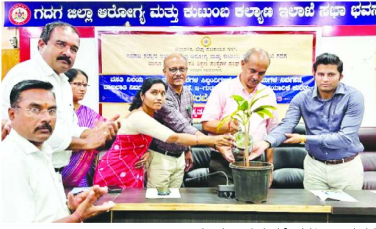
ಬೆಳಗಾವಿ ವಾರ್ಡ್ ಗದಗ: ಗದಗ ಜಿಲ್ಲಾಡಳಿತ, ಜಿಲ್ಲಾ ಪಂಚಾಯತ್, ಸಮಾಜ ಕಲ್ಯಾಣ ಇಲಾಖೆ ಗದಗ ಹಾಗೂ ಆರೋಗ್ಯ ಮತ್ತು ಕುಟುಂಬ ಕಲ್ಯಾಣ ಇಲಾಖೆ ಗದಗರವರ ಸಂಯುಕ್ತಾಶ್ರಯದಲ್ಲಿ ವಸತಿ ನಿಲಯಗಳ ಮತ್ತು ವಸತಿ ಶಾಲೆಗಳ ನಿರ್ವಹಣೆ, ದಾಖಲಾತಿಗಳ ನಿರ್ವಹಣೆ, ಆಹಾರ ಸುರಕ್ಷತೆ ಹಾಗೂ ಇ ಗುರುತು ಹಾಗೂ ಬಿಲ್ಗಳ ತಯಾರಿಕೆ ಕುರಿತು ಒಂದು