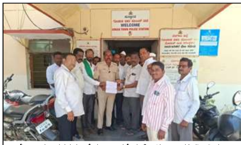
ಗೋಕಾಕ: ನಗರದ ಹೈಸ್ಕೂಲ ರಸ್ತೆಯಲ್ಲಿ (ಕಿಲ್ಲಾ ಹತ್ತಿರ) ನಿರ್ಮಾಣ ಮಾಡಿದ ಹೊಸ ಬ್ರಿಜ್ ಮೇಲೆ ನಡೆಯುತ್ತಿರುವ ಅಕ್ರಮ ಚಟುವಟಿಕೆಗಳಿಗೆ ಕಡಿವಾಣ ಹಾಕುವಂತೆ ಸ್ಥಳೀಯರು ಪೊಲೀಸ್ ಠಾಣೆಗೆ ಮನವಿ ಮಾಡಿದ್ದಾರೆ.

ಬೆಳಗಾವಿ ವಾರ್ತೆ ಗೋಕಾಕ: ನಗರದ ಹೈಸ್ಕೂಲ ರಸ್ತೆಯಲ್ಲಿ (ಕಿಲ್ಲಾ ಹತ್ತಿರ) ನಿರ್ಮಾಣ ಮಾಡಿದ ಹೊಸ ಬ್ರಿಜ್ ಮೇಲೆ ನಡೆಯುತ್ತಿರುವ ಅಕ್ರಮ ಚಟುವಟಿಕೆಗಳಿಗೆ ಕಡಿವಾಣ ಹಾಕುವಂತೆ ಸ್ಥಳೀಯರು ಪೊಲೀಸ್ ಠಾಣೆಗೆ ಮನವಿ ಮಾಡಿದ್ದಾರೆ.