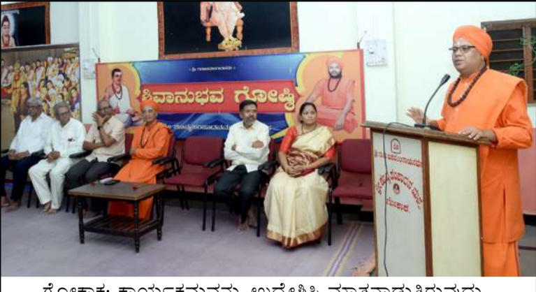
ಗೋಕಾಕ: ಕಾರ್ಯಕ್ರಮವನ್ನು ಉದ್ಘಾಟಿಸಿ ಮಾತನಾಡುತ್ತಿರುವುದು.