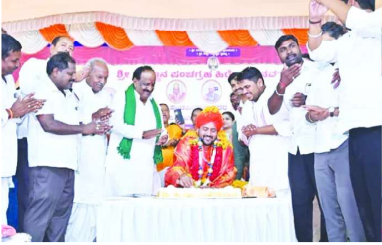
ಬೆಳಗಾವಿ ವಾರ್ತೆ ನವಲಗುಂದ: ನಾಡಿನೆಲ್ಲೆಡೆ ಆಧ್ಯಾತ್ಮ ಪ್ರವಚನ ಮೂಲಕ ಭಕ್ತ ಸಮೂಹದಲ್ಲಿ ಸನ್ಮಾರ್ಗದ ಸಂದೇಶಗಳನ್ನು ನೀಡುವುದರೊಂದಿಗೆ