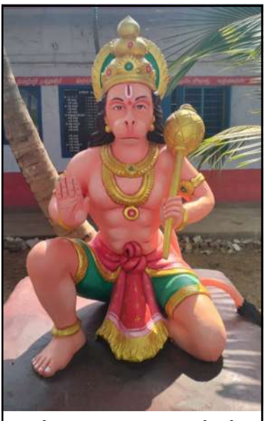
ಗೋಕಾಕ: ತಾಲೂಕಿನ ಬೆಟಗೆರಿ ವಿ.ವಿ.ದೇ ಸರಕಾರಿ ಪ್ರೌಢ ಶಾಲೆಯ ಆವರಣದಲ್ಲಿ ಶ್ರೀ ಹನುಮನ ನೂತನ ಮೂರ್ತಿ ಚಿತ್ರ.