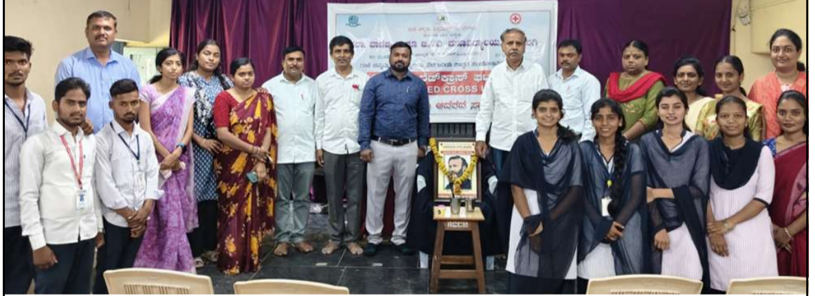
ಮೂಡಲಗಿ: ಪಟ್ಟಣದ ಮೂಡಲಗಿ ಶಿಕ್ಷಣ ಸಂಸ್ಥೆಯ ಕಲಾ, ವಾಣಿಜ್ಯ ಹಾಗೂ ಬಿಸಿಎ ಮಹಾವಿದ್ಯಾಲಯದ ಯುವ ರೆಡ್ ಕ್ರಾಸ್ ಘಟಕದ ಆಶ್ರಯದಲ್ಲಿ ವಿಶ್ವ ರೆಡ್ ಕ್ರಾಸ್ ದಿನಾಚರಣೆಯನ್ನು ಆಚರಿಸಲಾಯಿತು.