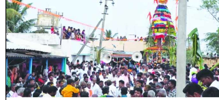
ಬೆಳಗಾವಿ ವಾರ್ಡ್ ನವಲಗುಂದ ತಾಲ್ಲೂಕಿನ ಶಾನವಾಡ ಗ್ರಾಮದ ಶ್ರೀ ಬಸವೇಶ್ವರ ದೇವರ ಜಾತ್ರೆಯಲ್ಲಿ ಹಾಗೂ ರಥೋತ್ಸವವಿ ಜ್ಯಂಭಣೆಯಿಂದ ರಥೋತ್ಸವ ಜರುಗಿತು