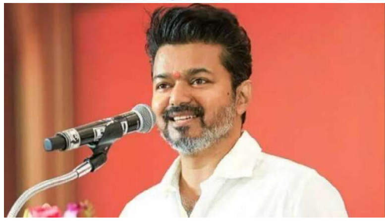
ಬೆಳಗಾವಿ ವಾರ್ತೆ ಚಿನ್ನೆ: ತಮಿಳುನಾಡಿನ ನೂತನ ಮುಖ್ಯಮಂತ್ರಿಯಾಗಿ ಪ್ರಮಾಣವಚನ ಸ್ವೀಕರಿಸಿದ ತಮಿಳು ವೆಟ್ಟಿ ಕಳಗಂ

(ಟಿವಿಕೆ) ಮುಖ್ಯಸ್ಥ, ನಟ ಜೋಸೆಫ್ ವಿಜಯ್, ಚುನಾವಣಾ ಪ್ರಣಾಳಿಕೆಯಲ್ಲಿ ಘೋಷಿಸಿದ ಎಲ್ಲಾ ಅಂಶಗಳನ್ನು ಈಡೇರಿಸುವ ಭರವಸೆ ನೀಡಿದ್ದಾರೆ.