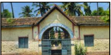
ಗೋಕಾಕ: ಸರಕಾರಿ ಹೊಸ ಮಾಧ್ಯಮಿಕ ಶಾಲೆ(ಜಿಎನ್‌ಎಸ್) ಗೋಕಾಕ.

ಬೆಳಗಾವಿ ವಾರ್ತೆ ಗೋಕಾಕ: ಸರಕಾರಿ ಹೊಸ ಮಾಧ್ಯಮಿಕ ಶಾಲೆ(ಜಿಎನ್‌ಎಸ್) ಗೋಕಾಕ ಸನ್ 2002-03ನೇ ಸಾಲಿನ ಎಸ್‌ಎಸ್‌ಎಲ್‌ಸಿ ವಿದ್ಯಾರ್ಥಿಗಳಿಂದ ಗುರುಗಳಿಗೆ ಗೌರವ ನಮನ ಹಾಗೂ 23ನೇ ವರ್ಷದ ಸ್ನೇಹಿತರ ಪುನರ್ ಮಿಲನದ ಕಾರ್ಯಕ್ರಮ ಇದೆ ದಿ.17ರಂದು ನಗರದ ಸ್ವೈಸ್ ಗಾರ್ಡನ್‌ನಲ್ಲಿ ಜರುಗಲಿದೆ.