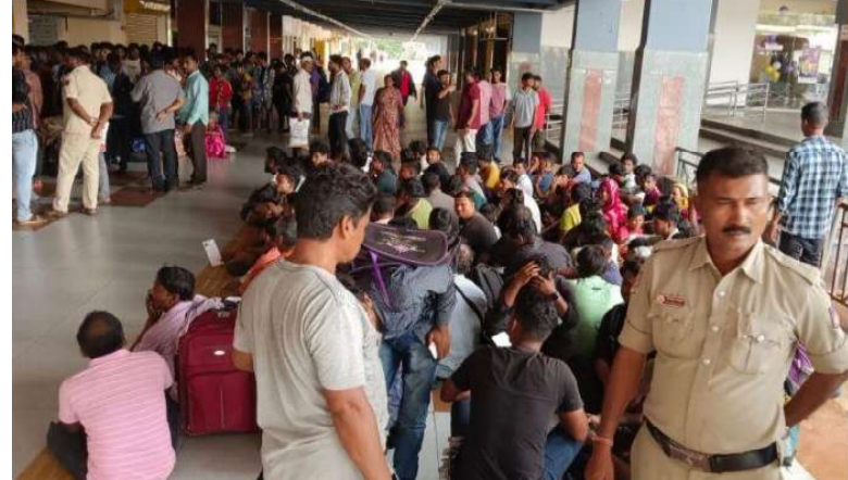
ಬೆಳಗಾವಿ ವಾರ್ತೆ ಹುಬ್ಬಳ್ಳಿ: ಪಶ್ಚಿಮ ತೆರಳುತ್ತಿದ್ದ 250ಕ್ಕೂ ಹೆಚ್ಚು ಜನರನ್ನು ಬಾಂಗ್ಲಾ ನುಸುಳುಕೋರರು ಎಂಬ

ಅನುಮಾನದ ಹಿನ್ನೆಲೆಯಲ್ಲಿ ಶನಿವಾರ ಗೋಕುಲ ರೋಡ್ ಹೊಸ ಬಸ್ ನಿಲ್ದಾಣದಲ್ಲಿ ತೀವ್ರ ತಪಾಸಣೆ ಮಾಡಲಾಯಿತು. ಬೆಳಿಗ್ಗೆ 11.30ರ ವೇಳೆಗೆ ಹೊಸ ಬಸ್ ನಿಲ್ದಾಣದಲ್ಲಿ ಏಕಕಾಲಕ್ಕೆ ಪಶ್ಚಿಮ ಬಾಂಗ್ಲಾದ 250ಕ್ಕೂ ಹೆಚ್ಚು ಜನ ಕಾಣಿಸಿಕೊಂಡಿದ್ದರು. ಇದರಿಂದ ಅನುಮಾನಗೊಂಡ ಹಿನ್ನೆಲೆಯಲ್ಲಿ ಅಕ್ರಮ ಬಾಂಗ್ಲಾ ವಾಸಿಗಳು ಆಗಮಿಸಿದ್ದಾರೆ ಎಂದು ಹಿಂದೂ ಸಂಘಟನೆಯವರು ಆರೋಪಿಸಿದ ಹಿನ್ನೆಲೆಯಲ್ಲಿ ಪೊಲೀಸ್ ಅಧಿಕಾರಿಗಳು ಅನ್ಯ ರಾಜ್ಯದ ಕಾರ್ಮಿಕರನ್ನು ಪರಿಶೀಲಿಸಿದರು. ಪಶ್ಚಿಮ ಬಾಂಗ್ಲಾದಿಂದ ಅಮರಾವತಿ ಹುಬ್ಬಳ್ಳಿ ರೈಲ್ವೆ ಮೂಲಕ ಹುಬ್ಬಳ್ಳಿಗೆ ಆಗಮಿಸಿದ್ದಾರೆ ಎನ್ನಲಾಗಿದ್ದು, ಪೊಲೀಸ್ ಅಧಿಕಾರಿಗಳು ಹೊಸ ಬಸ್ ನಿಲ್ದಾಣದ ಪೊಲೀಸ್ ಹೊರ ತಾಣ ಹಾಗೂ ವಿಶ್ರಾಂತಿ ಗೃಹದಲ್ಲಿ ಸುಮಾರು 200 ಜನರ ದಾಖಲಾತಿಗಳನ್ನು ಪರಿಶೀಲಿಸಿದರು. ಪಶ್ಚಿಮ ಬಾಂಗ್ಲಾ, ಒರಿಸ್ಸಾ, ಜಾರ್ಖಂಡ್ ಹಾಗೂ ಬಿಹಾರ ರಾಜ್ಯದ ಕೂಲಿ ಕಾರ್ಮಿಕರು ಗೋವಾ ರಾಜ್ಯ ಹಾಗೂ ಕರ್ನಾಟಕ ರಾಜ್ಯದ ಕೆಲವು ಜಿಲ್ಲೆಗಳಲ್ಲಿ ಕೂಲಿ ಕೆಲಸ ಮಾಡುತ್ತಿರುವವರು ಎಂದು ತಿಳಿದು ಬಂದಿದೆ.