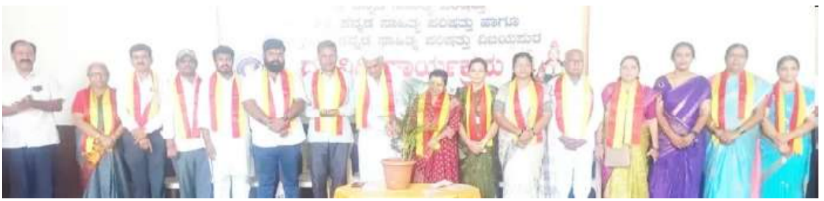
ಬೆಳಗಾವಿ ವಾರ್ತೆ ವಿಜಯಪುರ: