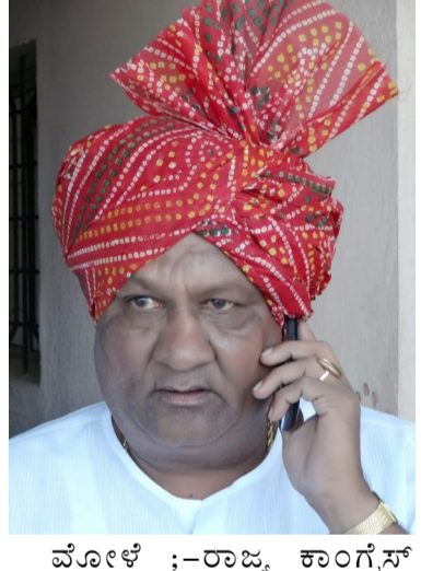
ಮೋಳೆ :-ರಾಜ್ಯ ಕಾಂಗ್ರೆಸ್